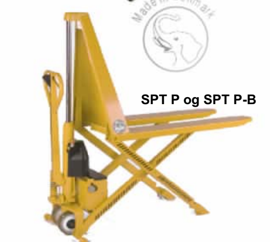
SPT P og SPT P-B