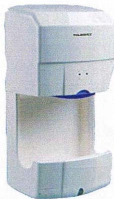
S85A Mål: (HxBxL) 50x15x24